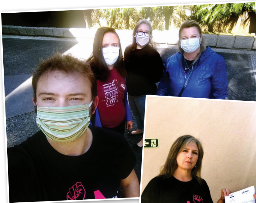
Direções do SISMMAC e do SISMUC têm cobrado a Prefeitura sobre as questões referentes a EaD, RIT, e condições de trabalho em tempos de pandemia

Já o atendimento jurídico presencial e individual será reduzido em dois dias na semana, apenas para os casos que não poderão ser resolvidos via contato telefônico.