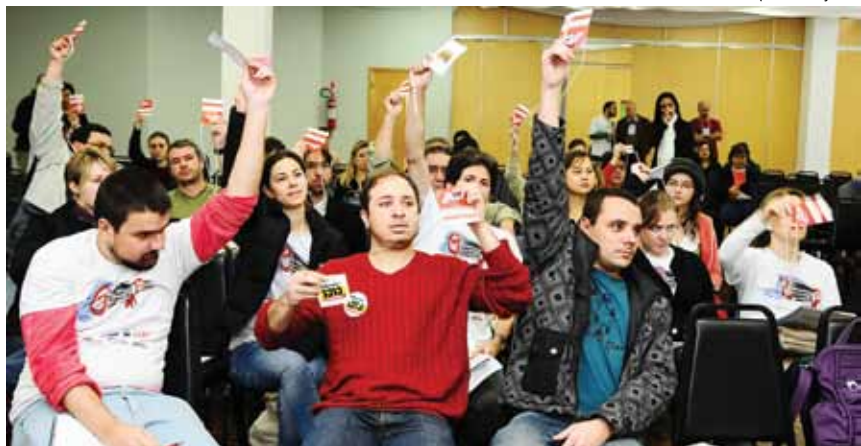
Quem quer as PECs votadas e aprovadas levante a mão!